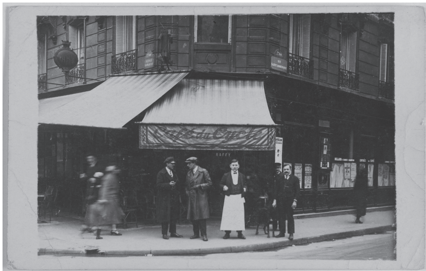
Le Campanella dans les années 1920...